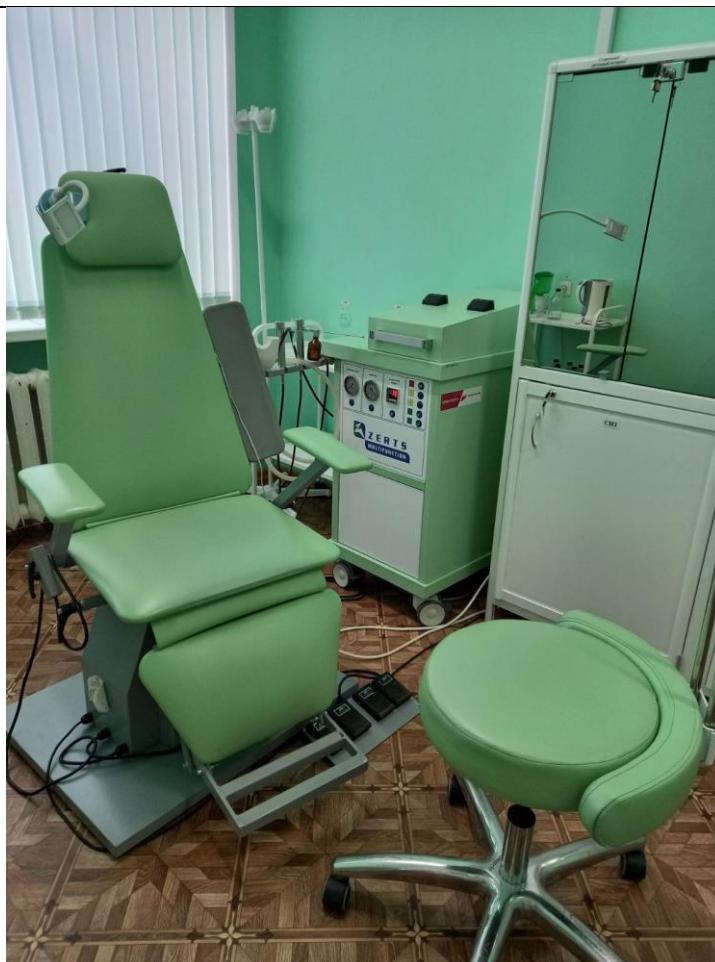
Риноларингофи броскоп PENTAX FNL – 10RBS